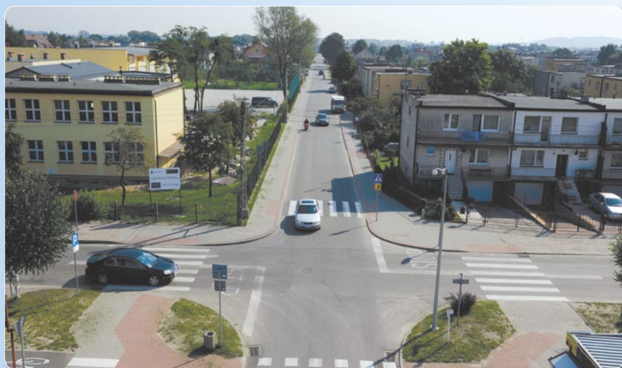
Modernizacja - ul. Nowa.