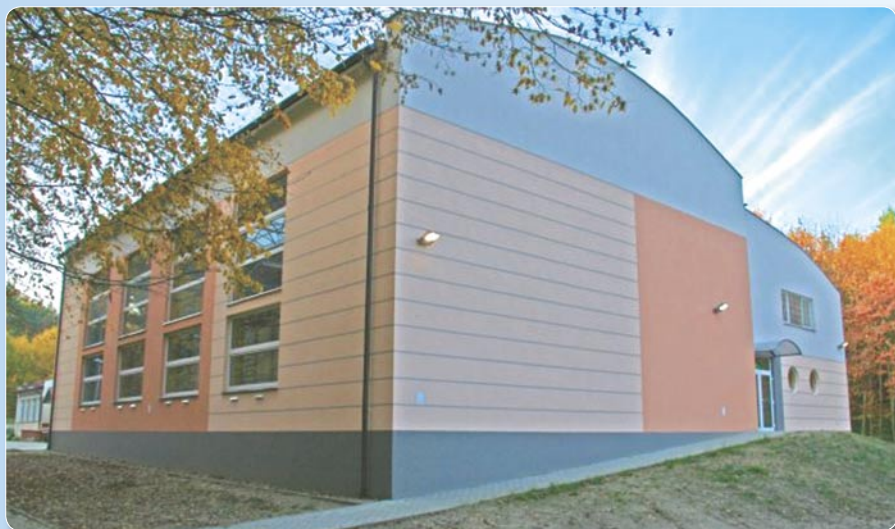
Budowa sali przy SP nr 5. Koszt ogółem: 2 570 370 zł