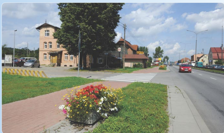
Modernizacja - ul. Gdańska.