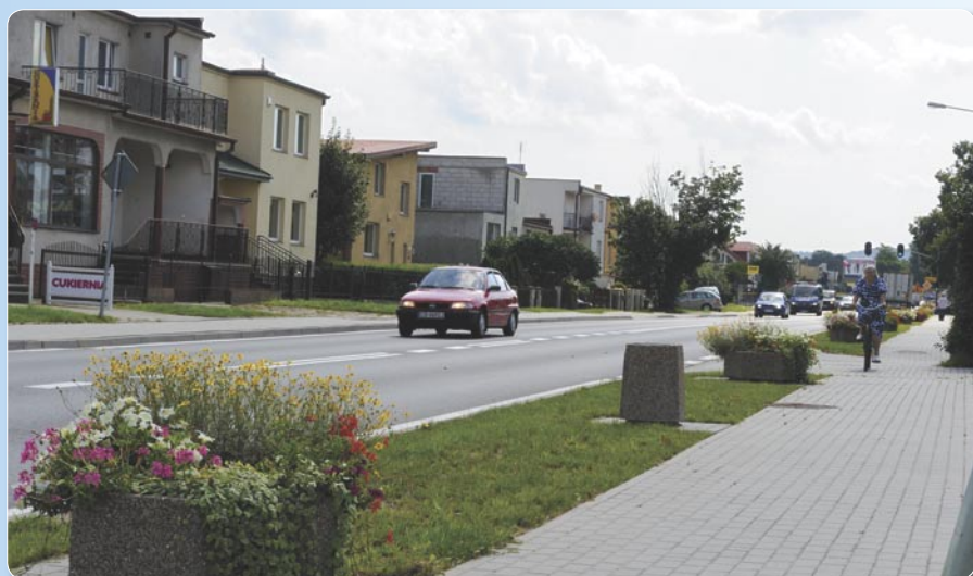
Modernizacja - ul. Pucka.