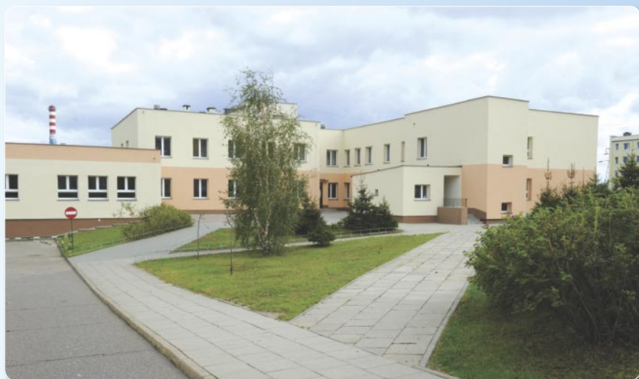
Termomodernizacja ZS nr 1. Koszt ogółem: 2370 670 zł.