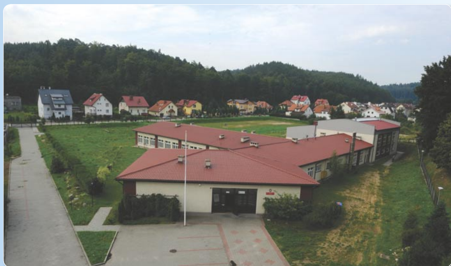
Budowa sali przy SP nr 6.