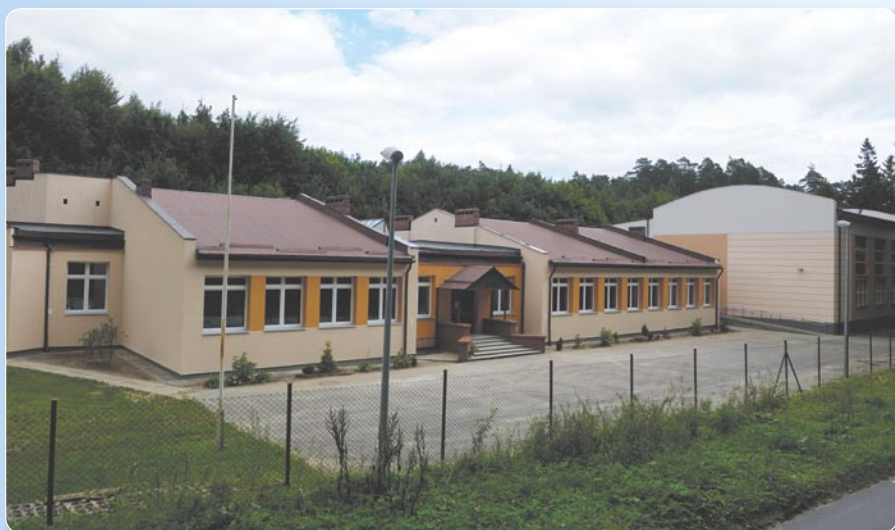
Termomodernizacja SP nr 5. Koszt ogółem: 344 000 zł.