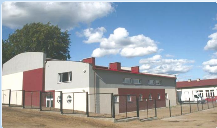
Budowa sali przy SP nr 6. Koszt 2 314 450 zł