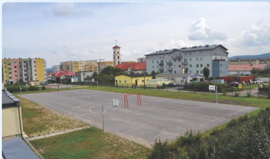
Boisko przy Sp nr 2. Koszt ogółem: 35 000 zł.