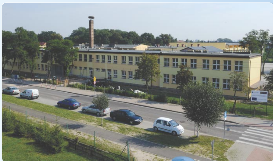
Termomodernizacja ZS nr 2. Koszt ogółem 1 508 000 zł.