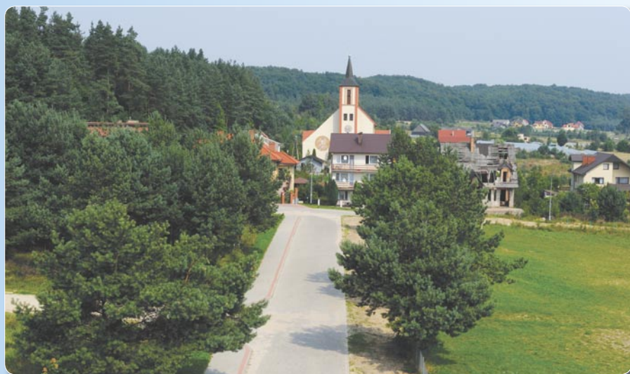
Modernizacja - ul. Korzenna.