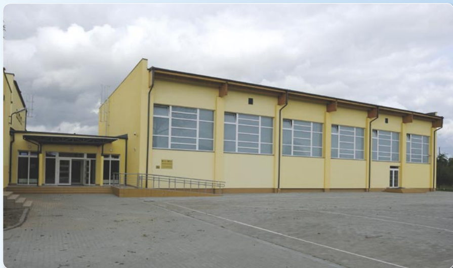
Budowa sali przy ZS nr 2. Koszt ogółem: 4 200 000 zł.