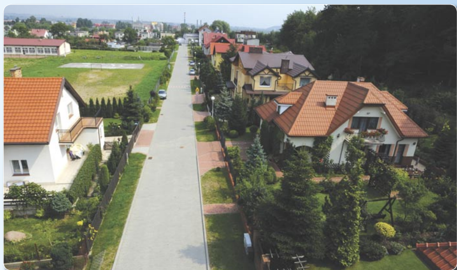
Modernizacja - ul. Piaskowa.