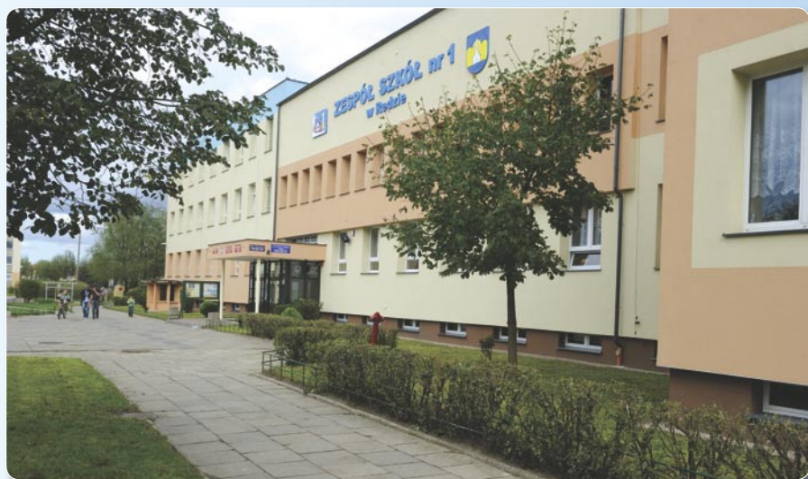
Termomodernizacja ZS nr 1.