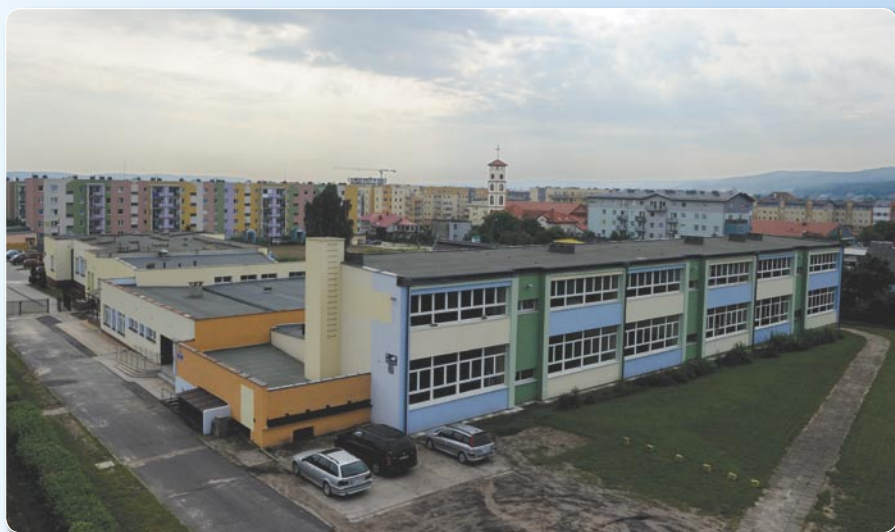
Termomodernizacja SP nr 2. Koszt ogółem 759 030 zł.