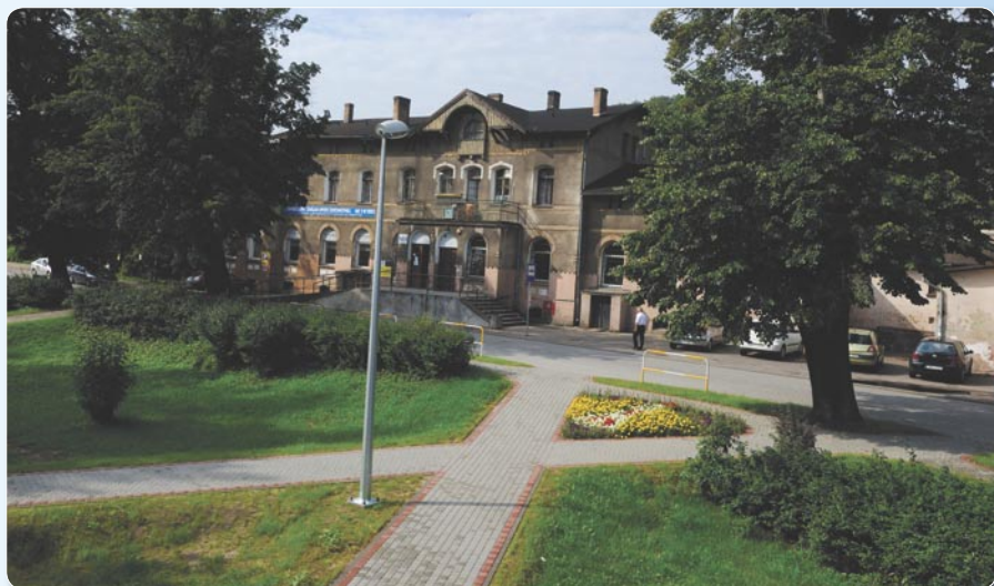
Modernizacja - rejon dworca – ulica z kostki.